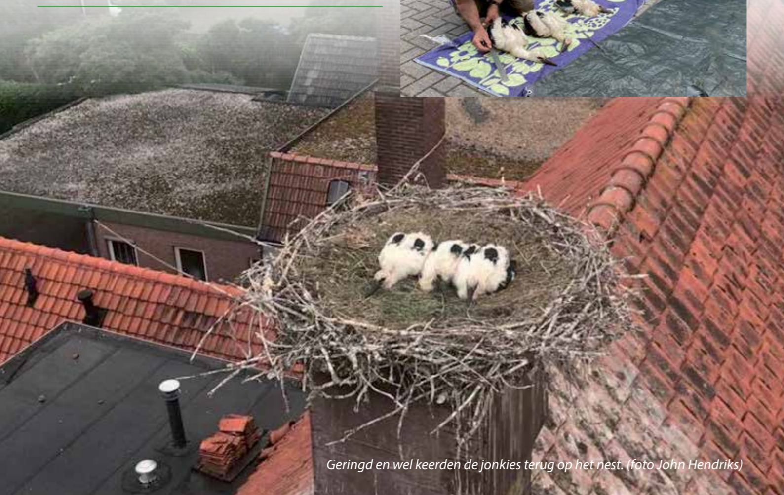
Geringd en wel keerden de jonkies terug op het nest.