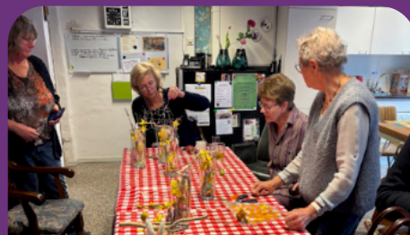
PAASACTIVITEIT IN DE PROST