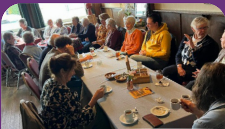
EEN GEZELLIG KOFFIE UURTJE