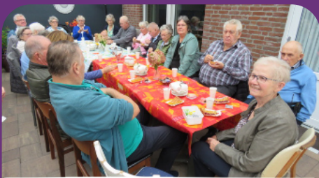
BURENDAG OP DE BRINK