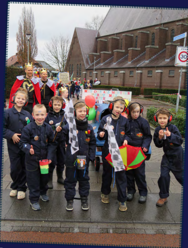
Een nieuwe, hele jonge, groep in de optocht. Deze 8 en 9-jarigen bouwden de wagen van Max Verstappen en liepen mee als de monteurs van hem.