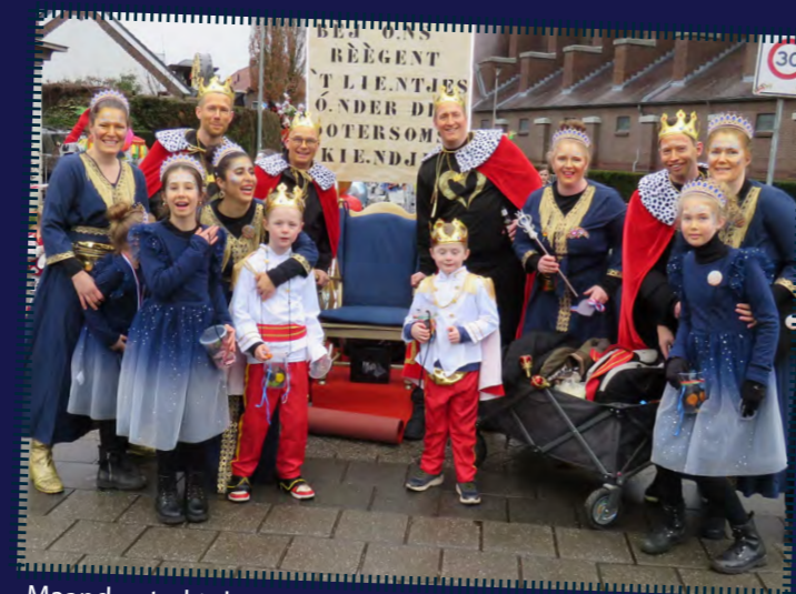
Maandag trekt de grote optocht door ons dorp. Veel loopgroepen aangevuld met prachtige praalwagens.