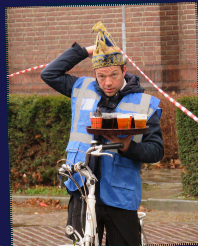
De fietsende ober, overal paraat.