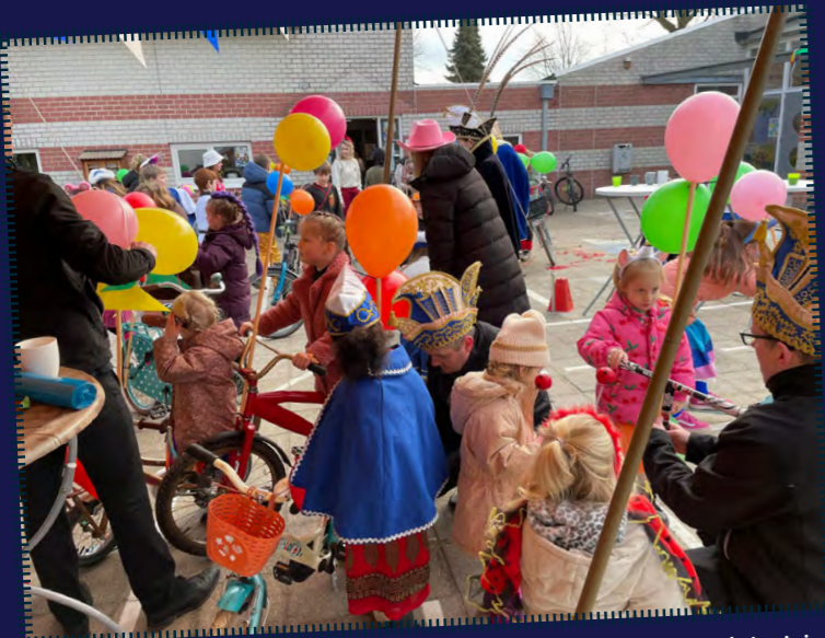
Op vrijdagmorgen ziet de speelplaats er bont uit. Met elektriciteitsbuizen, tie-wraps, gekleurde ballonnen en slingers versieren de raadsleden samen met de kinderen in no time hun fietsen.