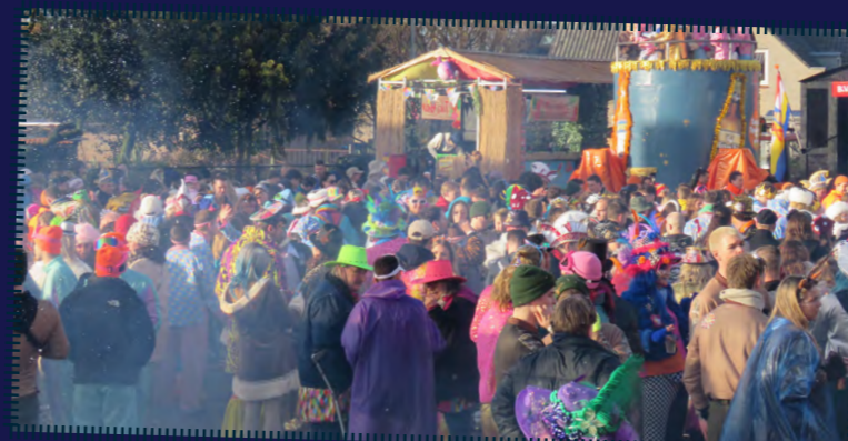
Ondanks het wat kille weer stroomde het Jozefplein, naast de Heldro, op maandagmiddag helemaal vol met carnavalsvierders waar de muziek prima klonk en de drank rijkelijk vloeide. Dit alles onder een schitterende sfeer.