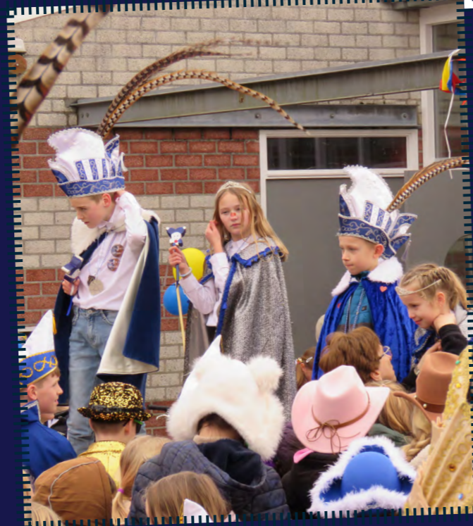
De prinsen- en prinsessenparen van de onder- en bovenbouw regeren van maandag tot vrijdag op De Brink. Hier leveren ze de sleutels in waarna een grote polonaise volgt