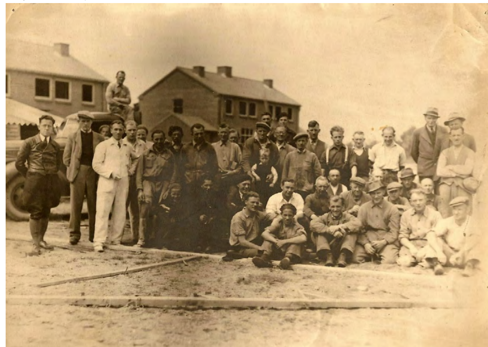
Werknemers bezig met de bouw in de Prinsessenbuurt Gennep (1949-1950)

Refrein: Mchtig moj, mchtig moj Ootersóm, lèève lang