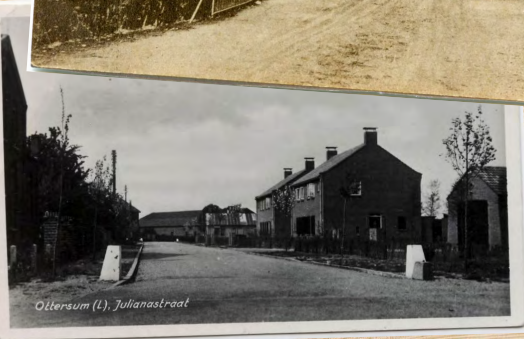
Ottersum (L), Julianastraat