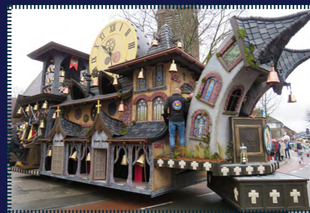
Een hele grote praalwagen uit het naburige Groesbèk. De wagens uit dit dorp geven een duidelijke meerwaarde aan de Maskottersoptocht.